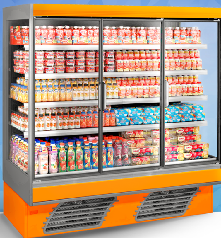
Simbolo categoría de alimentos